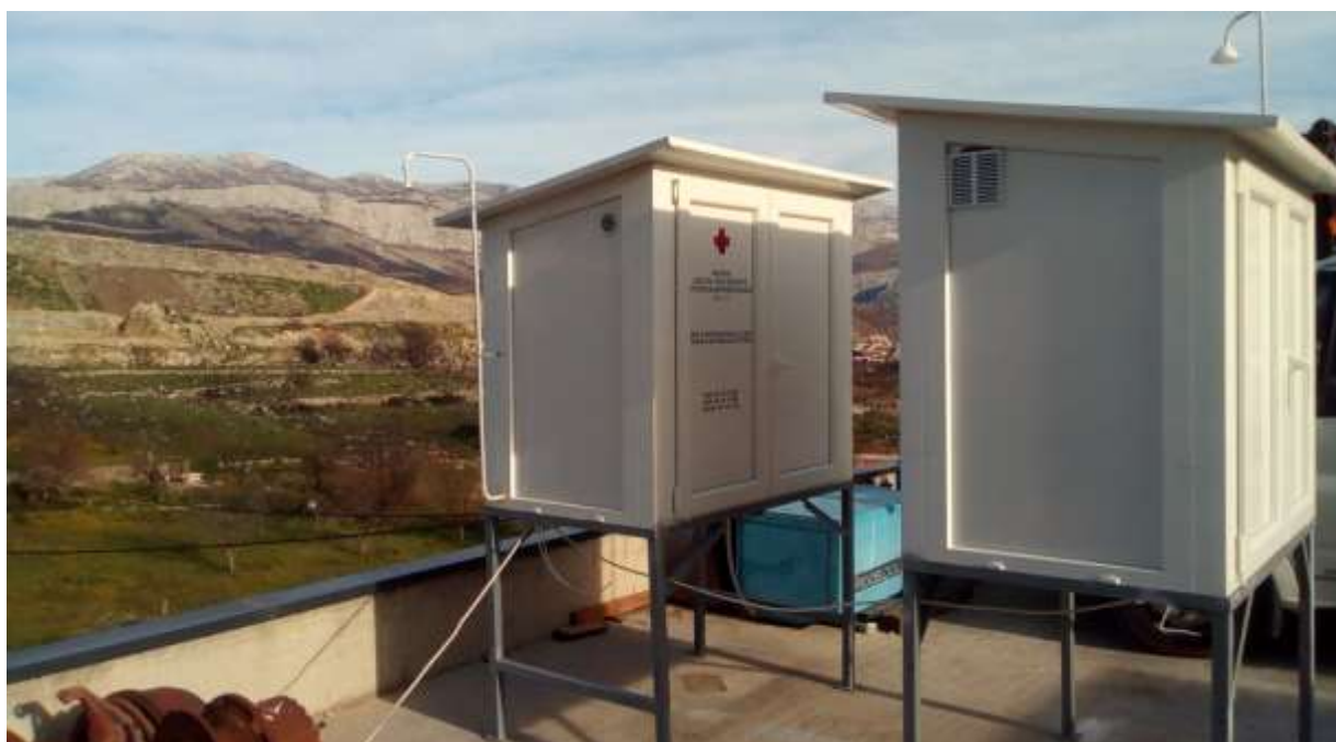
Slika 1. Automatska mjerna stanica „Karepovac“