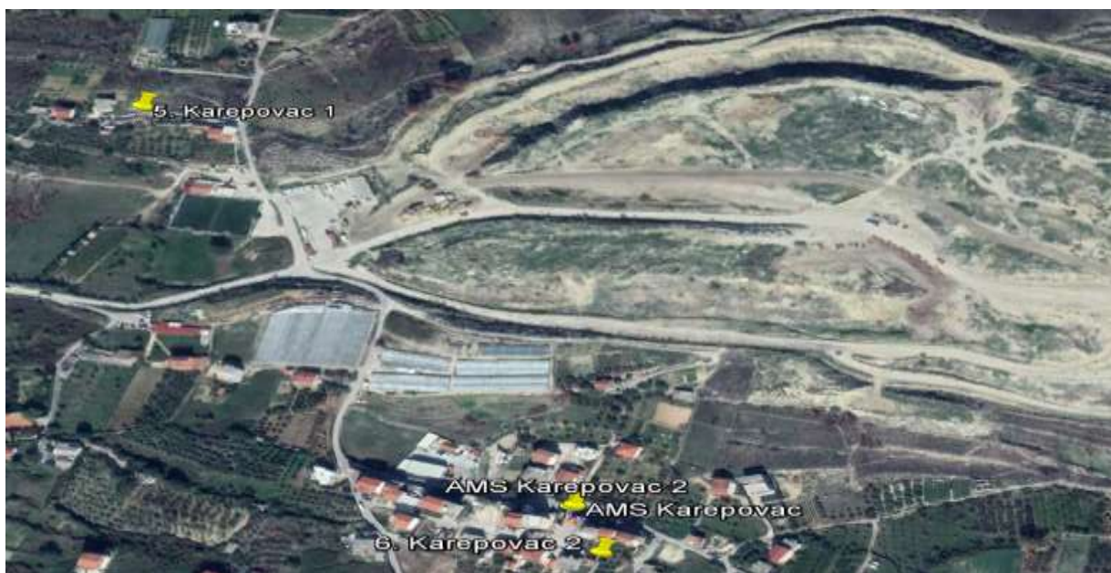
Slika 2. Lokacija mjernih mjesta Karepovac 1 (5.) i Karepovac 2 (6.)