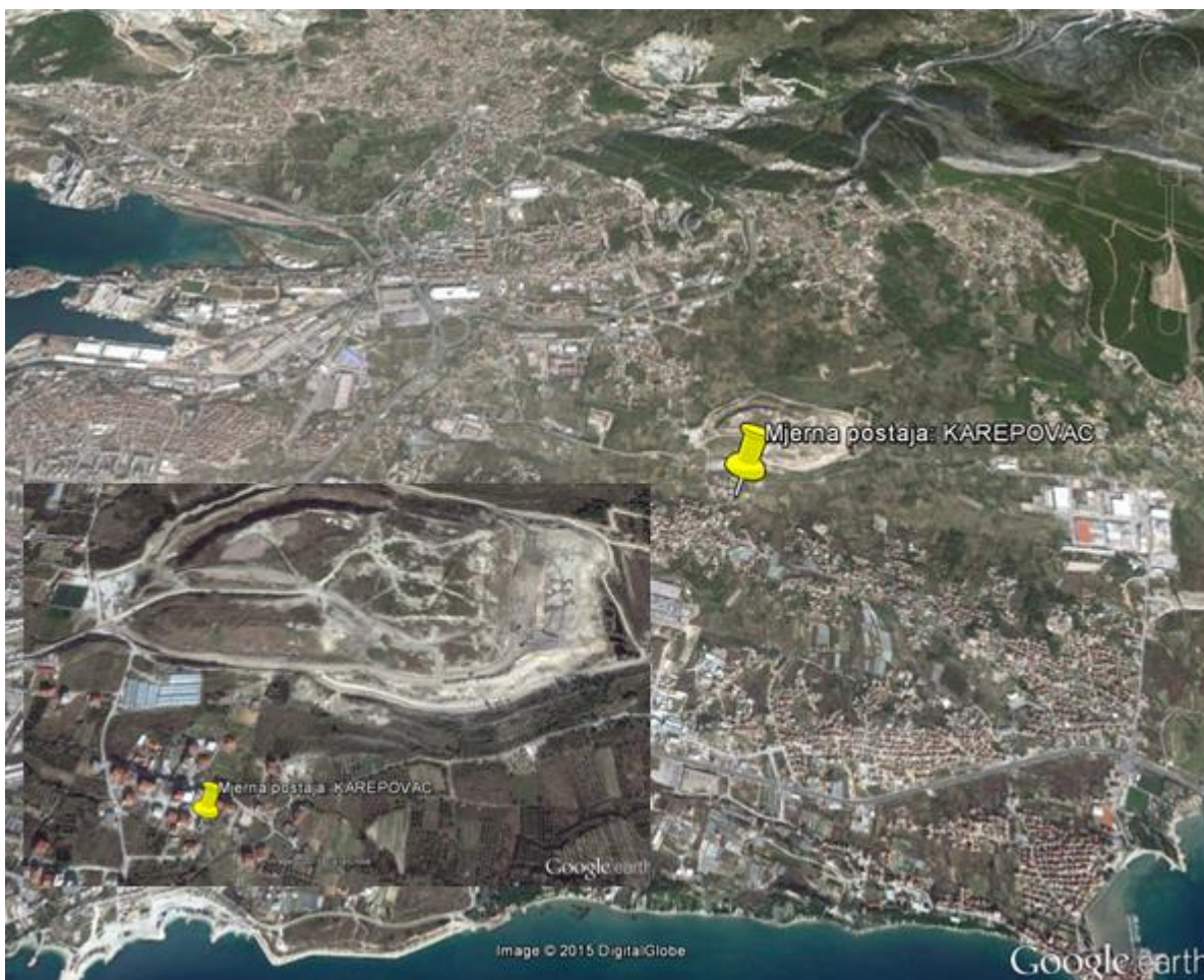
Slika 1. : Položaj postaje „Karepovac“