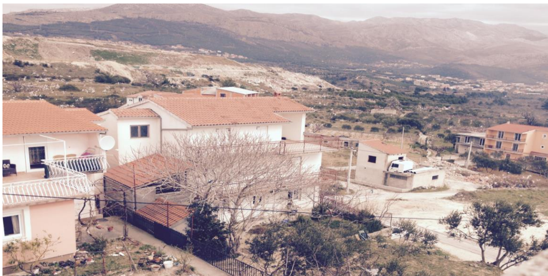
Slika 2. : Pogled s mjernog mjesta na odlagalište otpada „Karepovac“